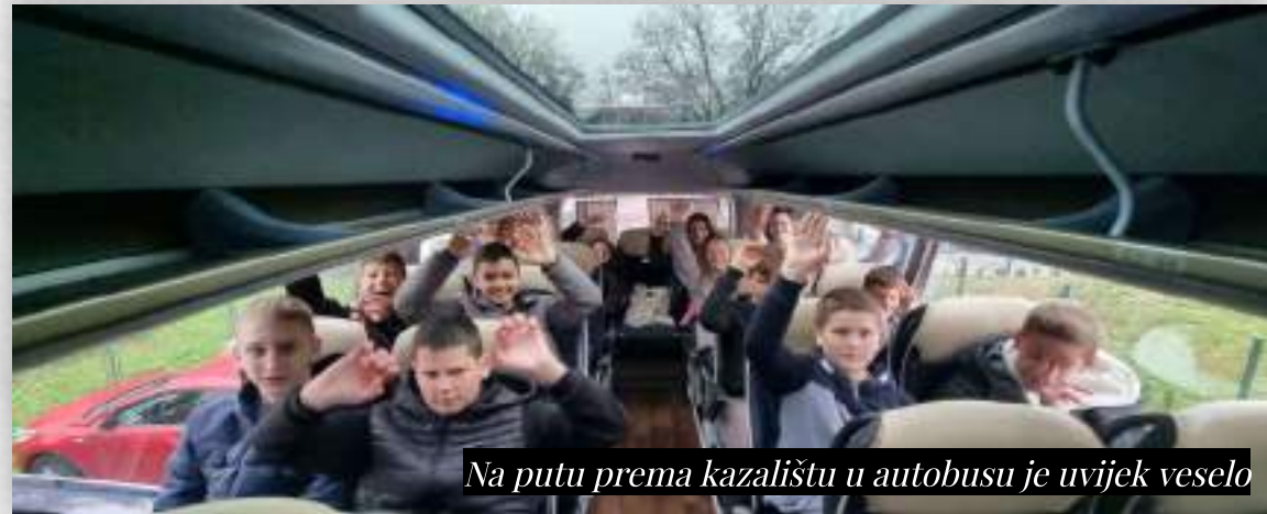
Na putu prema kazalištu u autobusu je uvijek veselo