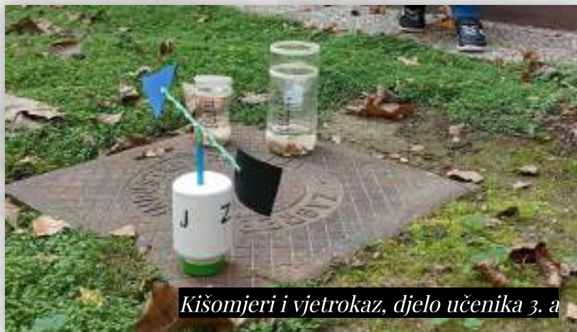
Kišomjeri i vjetrokaz, djelo učenika 3. a