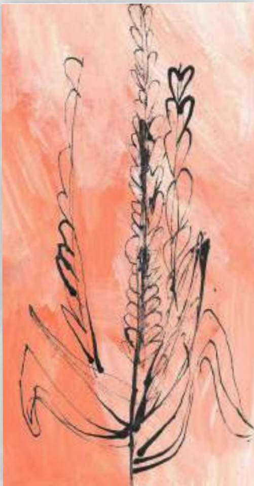
Leon Teklić, 2.b

Svatko može naići na dezinformaciju ili lažnu vijest.