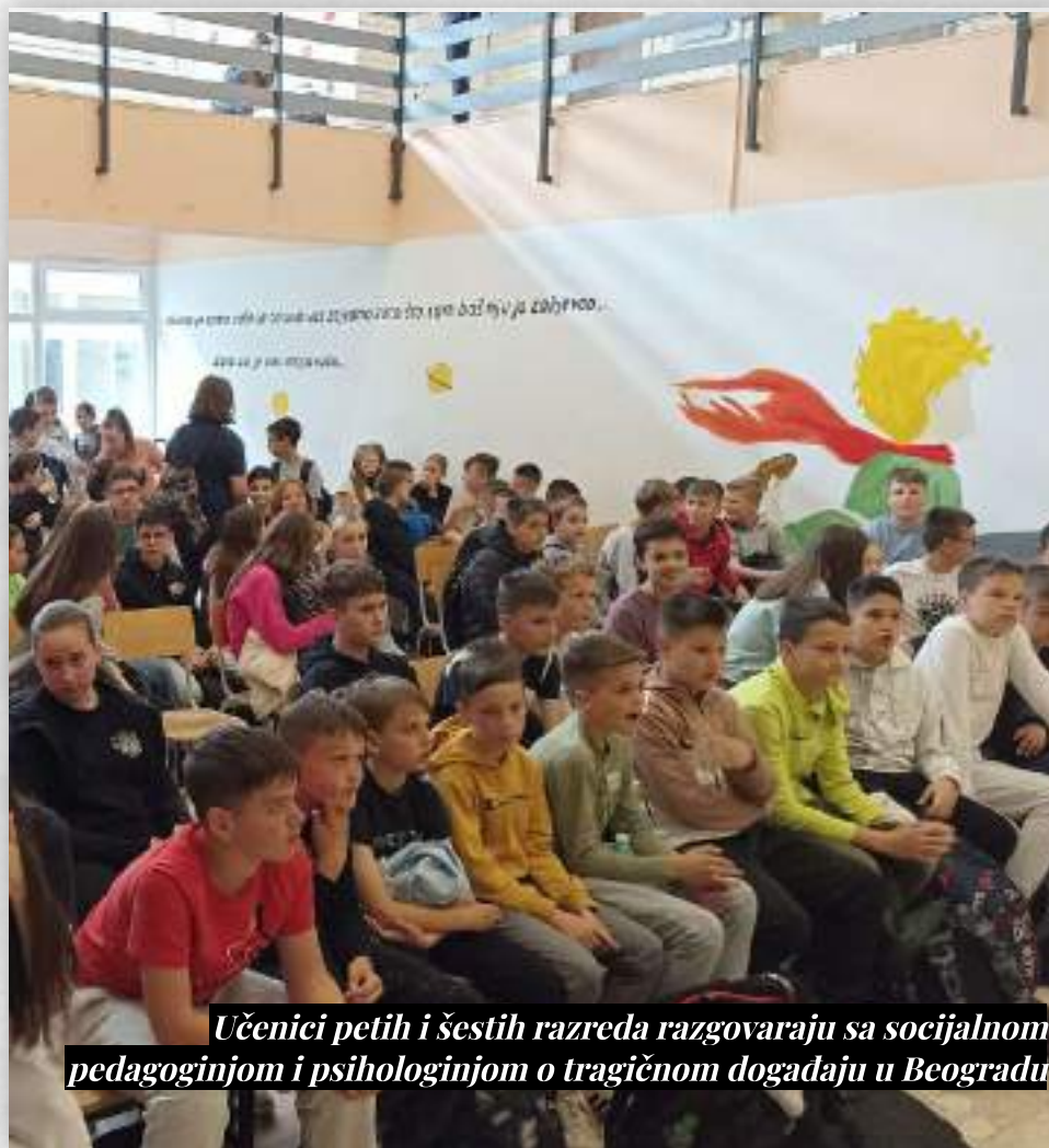
Učenici petih i šestih razreda razgovaraju sa socijalnom pedagoginjom i psihologinjom o tragičnom događaju u Beogradu

U slobodno vrijeme volim heklati, izrađivati poklone i baviti se kreativnim radom. Volim keramiku i baviti se humanitarnim radom. To je nešto čime se planiram baviti nakon završetka radnoga staža.