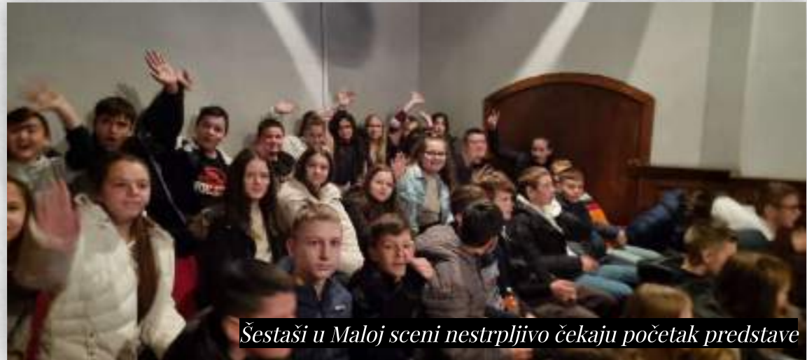
Šestaši u Maloj sceni nestrpljivo čekaju početak predstave